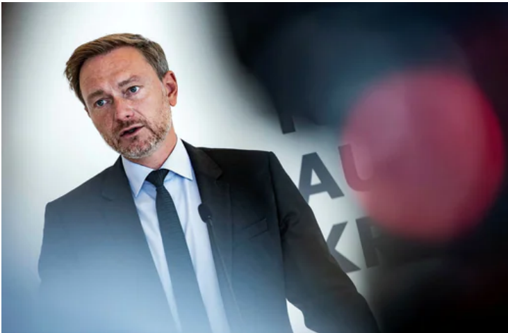
Christian Lindner (FDP) kan spela en viktig roll vid regeringsbildningen.

Marknadsliberala FDP har regerat med såväl SPD som CDU/CSU, och var länge känt som "der Königsmacher" – kungamakaren. Även vid årets val kan partiet, som leds av 42-åriga Christian Lindner, spela en avgörande roll för vem som blir förbundskansler.