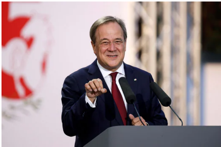
Armin Laschet, CDU/CSU:s kanslerkandidat.