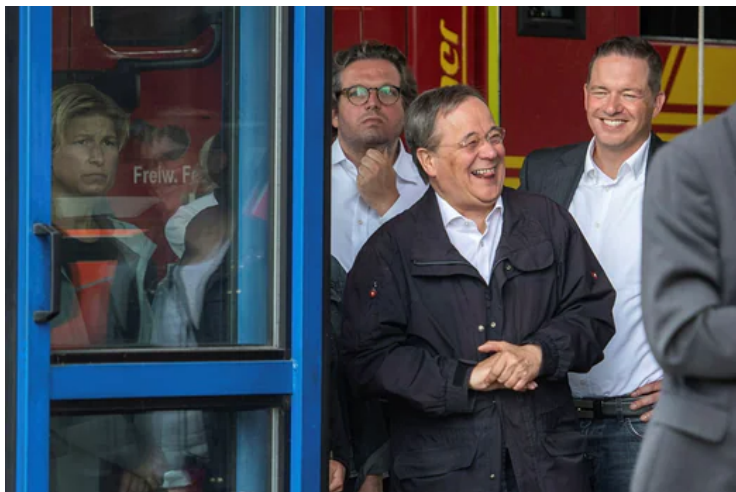
Bilden där kanslerkandidaten Armin Laschet skrattar i ett sammanhang som handlade om översvämningarna med hundratals dödsoffer.

... eller inte alls. Sommarens översvämningar gav Armin Laschet en chans att visa väljarna att de kan lita på honom när det verkligen gäller.